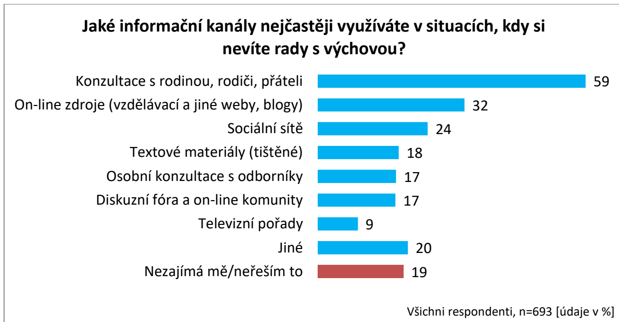
Graf 1: Informační kanály v případě problémů s výchovou dětí

„Podívali jsme se také na kombinaci konzultací s rodinou a využívání ostatních informačních kanálů. Dvě pětiny rodičů se radí jak v rámci rodiny, tak s dalšími zdroji, víc než pětina (23 %) hledá radu v dalších zdrojích ale ne u rodiny a necelá pětina (19 %) rodičů se obrací pro radu jen v rámci rodiny. Konzultaci s rodinou i dalšími zdroji aplikují častěji matky, rodiče do 44 let a rodiče s vysokoškolským vzděláním než rodiče z jiných sociálních skupin,“ doplňuje Darja Bergman z agentury STEM/MARK.